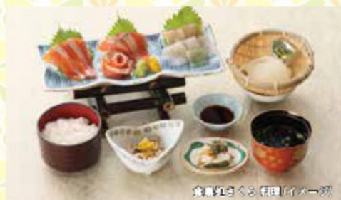
食い尽くる(和)ダイナー