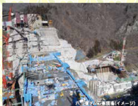
ハッ場ダム工事現場(イメージ)