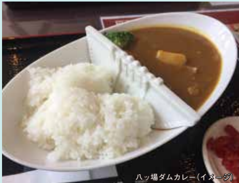
ハッ場ダムカレー(イメージ)