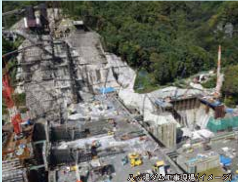
ハッ場ダム工事現場(イメージ)